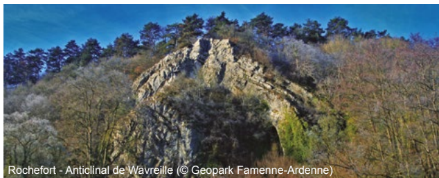
Rochefort - Anticlinale de Wavreille

Geoparken zijn plaatsen van internationaal geologisch belang, met een omvattende aanpak van erfgoedbescherming, educatie, wetenschap en duurzame ontwikkeling. Ze maken allemaal deel uit van het Global Geoparks Network.