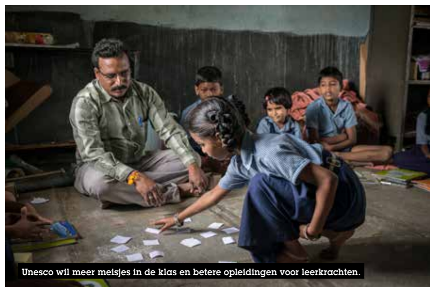
Unesco wil meer meisjes in de klas en betere opleidingen voor leerkrachten.

Voor de komende twee jaar beschikt Unesco over een budget van 507 miljoen dollar, een daling van liefst 146 miljoen dollar. De daling is toe te schrijven aan de beslissing van onder meer Verenigde Staten om niet langer lidmaatschap te betalen aan Unesco. De VS nam die beslissing na de vorige Algemene Conferentie die Palestina aanvaardde als lid van de Organisatie. Omdat het land niet langer bijdraagt tot de financiering van de Organisatie, beschikt het niet langer over stemrecht. De VS blijft wel lid van Unesco.