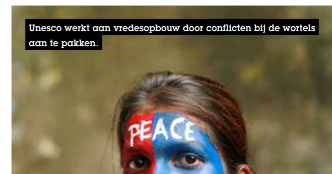
Unesco werkt aan vredesopbouw door conflicten bij de wortels aan te pakken.

Wat communicatie betreft, zal Unesco het VN-wereldactieplan voor de veiligheid van journalisten wereldwijd verder opvolgen. Dat ook cultuur een invloedrijke rol speelt in de ontwikkeling van gemeenschappen en empowerment van individuen wordt steeds duidelijker. Erfgoed bindt gemeenschappen, versterkt hun identiteit en biedt een fundament om samen aan de toekomst te werken. In de voorbije jaren hebben extremisten in Egypte, Mali en andere delen van de wereld culturele oriëntatiepunten of zogeheten landmarks toegenomen. Unesco wil blijven expertise en bijstand verlenen aan gemeenschappen bij het herstellen, beheren en bewaren van hun roerend en immaterieel erfgoed, zeker wanneer het in gevaar is. Ook onderwijs en het vergroten van expertise ter plaatse behoren hier tot de taken.