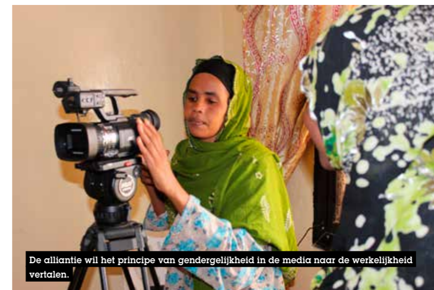
De alliantie wil het principe van gendergelijkheid in de media naar de werkelijkheid vertalen.