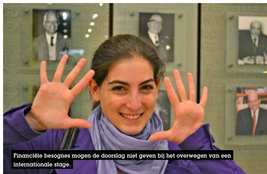
Financiële besognes mogen de doorslag niet geven bij het overwegen van een internationale stage.