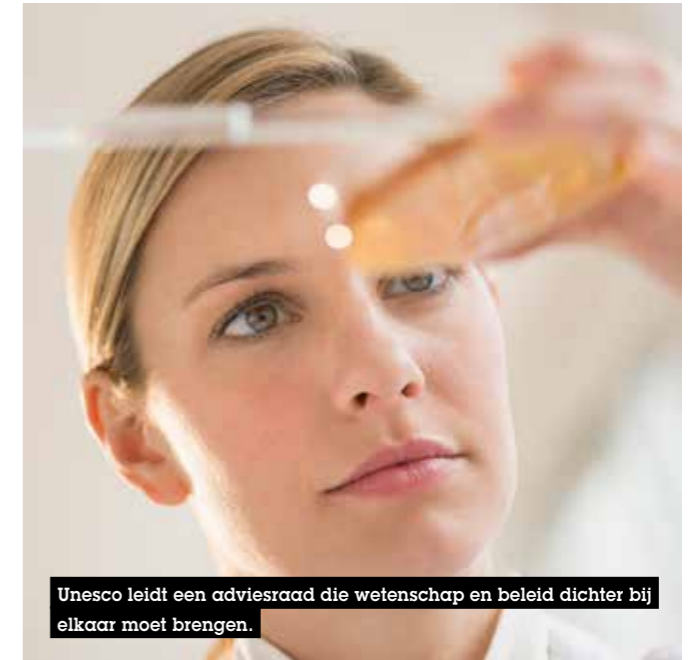
Unesco leidt een adviesraad die wetenschap en beleid dichter bij elkaar moet brengen.

Unesco voert al langer onderzoek naar de relatie tussen wetenschappelijke vooruitgang en ontwikkeling. De Organisatie was dan ook de logische keuze om de wetenschappelijke adviesraad te huisvesten