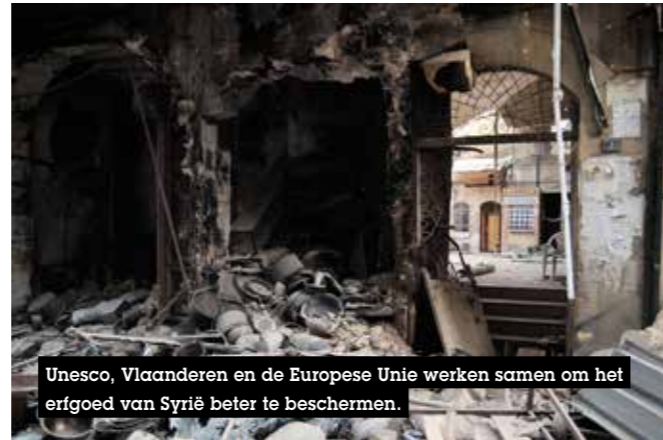
Unesco, Vlaanderen en de Europese Unie werken samen om het erfgoed van Syrië beter te beschermen.

In vergelijking met de Europese instellingen zijn de fondsen van Vlaanderen beperkt, maar door deze door de EU gevraagde cofinanciering kan Vlaanderen wel een sleutelrol gaan spelen bij de