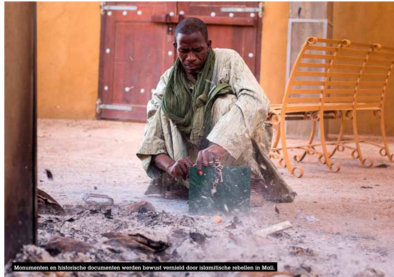
Monumenten en historische documenten werden bewust vernield door islamitische rebellen in Mali.

Op het terrein zette Unesco zich in 2013 vooral in om haar lidstaten te ondersteunen bij het verbeteren van de opleiding van leerkrachten. In Maleisië werkte de Organisatie mee aan een grondige doorlichting van het onderwijssysteem om het beter af te stemmen op de hedendaagse behoeften. De cruciale rol van leerkrachten in het onderwijs is de rode draad van het Education for All Global Monitoring Report dat Unesco in januari 2014 voorstelde. ▶