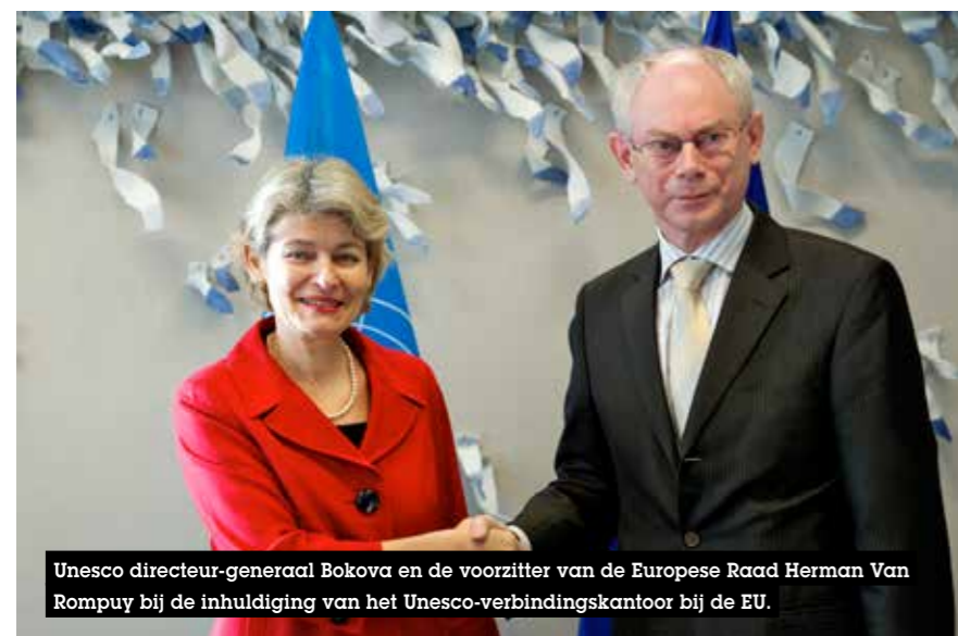
Unesco directeur-generaal Bokova en de voorzitter van de Europese Raad Herman Van Rompuy bij de inhuldiging van het Unesco-verbindingkantoor bij de EU.

Ondanks het feit dat deze concrete samenwerking eerder een fenomeen is van de laatste jaren is ze naast op de algemene principes rond de efficiëntie van hulp ook gestoeld op een aantal gedeelde morele principes die deze verschillende actoren sinds jaar en dag aanhangen: een gemeenschappelijk waardenkader gebaseerd op de Universele Verklaring van de Rechten van de Mens en het geloof in multilateralisme als middel bij uitstek om mondiale problemen op te lossen.