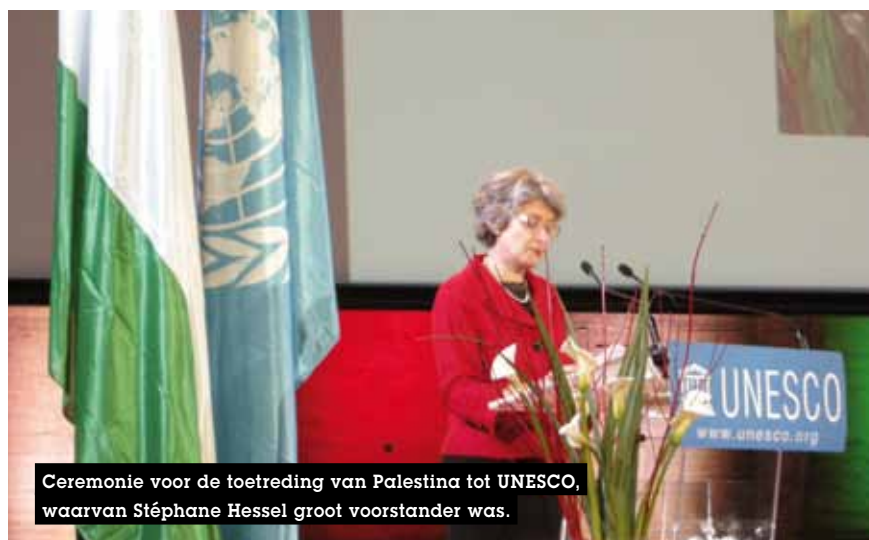
Ceremonie voor de toetreding van Palestina tot UNESCO, waarvan Stéphane Hessel groot voorstander was.

Stéphane Hessel: Het succes verheugde me. De boekjes, die niet meer dan 30 bladzijden telden en vertaald zijn in een dertigtal talen, leidden tot mobilisatie in verschillende landen.