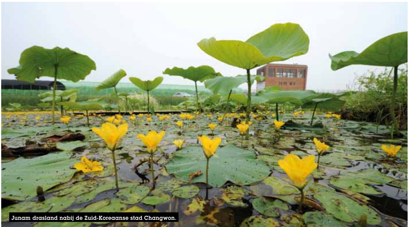
Junam drasland nabij de Zuid-Koreaanse stad Changwon.

De centrale vraag is: hoe kunnen we de toegang tot de kostbare waterbronnen garanderen voor een steeds groeiende bevolking en ▶