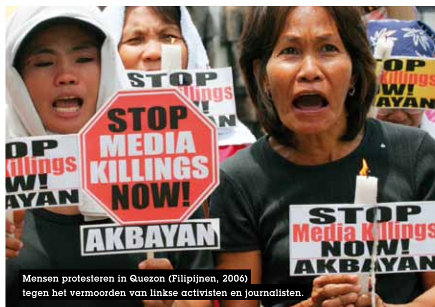
Mensen protesteren in Quezon (Filipijnen, 2006) tegen het vermoorden van linkse activisten en journalisten.

De strategie bevat meer dan honderd concrete acties, door verschillende VN-agentschappen uit te voeren in de komende twee jaar. Daarbij zullen de agentschappen nauw samenwerken met andere betrokken instanties die zich eveneens bekommeren over het welzijn van journalisten en medewerkers van pers en media.