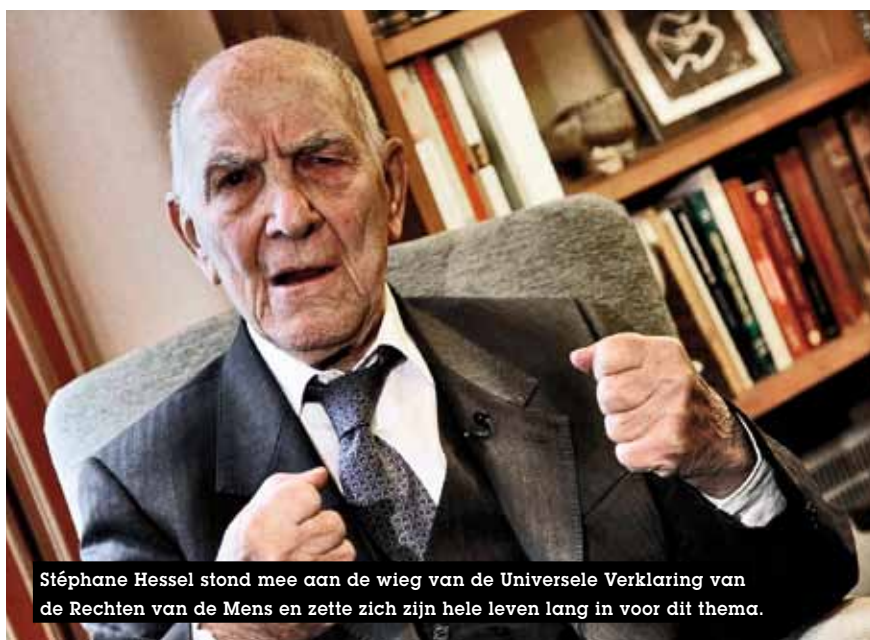
Stéphane Hessel stond mee aan de wieg van de Universele Verklaring van de Rechten van de Mens en zette zich zijn hele leven lang in voor dit thema.

De eerste UNESCO/Bilbao Prijs voor de Promotie van een Cultuur van Mensenrechten ging in 2008 naar Stéphane Hessel die op 27 februari 2013 overleed. Aanleiding was de zestigste verjaardag van de Universele Verklaring van de Rechten van de Mens waarvan hij medeopsteller was. In december 2012 spraken we met hem over Desmond Tutu, de laureaat van de UNESCO/Bilbao Prijs 2012. Hij uitte zijn bezorgdheid over de aanhoudende schendingen van de mensenrechten maar toonde zich tezelfdertijd enthousiast over de geboekte vooruitgang.