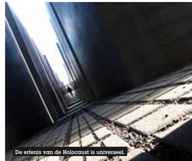
De erfenis van de Holocaust is universeel.

Om de ontwikkeling van de Holocausteducatie wereldwijd te ondersteunen, lanceert UNESCO twee nieuwe projecten: het wereldwijd in kaart brengen van onderricht over de Holocaust en het organiseren van regionaal overleg met dertien Afrikaanse landen over het thema Waarom lesgeven over genocide? Het voorbeeld van de Holocaust . Voor het eerst zullen Afrikaanse experts uit het onderwijsveld over dit onderwerp diepgaande besprekingen kunnen voeren met gespecialiseerde leerkrachten en Holocaust- en genocide-onderzoekers.