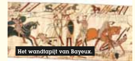
Het wandtapijt van Bayeux.

Het Memory of the World programma wakkert het bewustzijn aan over het bestaan en het belang van documentair erfgoed en helpt de lidstaten van UNESCO om documentair erfgoed te bewaren via praktische en technische