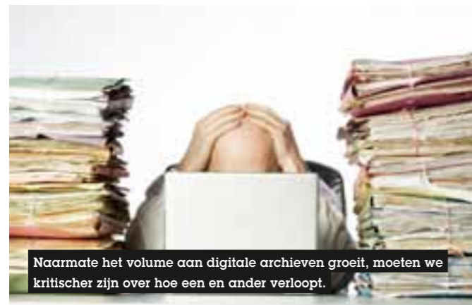
Naarmate het volume aan digitale archieven groeit, moeten we kritischer zijn over hoe een en ander verloopt.

Anne Thurston: Overheden introduceren dikwijls digitale systemen zonder stil te staan bij wat dit betekent voor het garanderen van de integriteit van de documenten die dergelijke systemen produceren. Dit heeft onder meer te maken met de snelle verandering van beschikbare software en hardware. De digitale archieven van het gevoerde beleid, de overheidsmaatregelen en de overheidstransacties kunnen enkel authentiek en bruikbaar blijven op lange termijn als daarvoor internationale standaarden worden toegepast. Zo moeten metadata