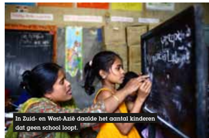
In Zuid- en West-Azië daalde het aantal kinderen dat geen school loopt.

“We zijn amper drie jaar verwijderd van de vooropgestelde datum waarop we de doelstelling van universeel basisonderwijs wilden bereiken, deze trend is dus uiterst zorgwekkend. Toegang tot onderwijs is niet alleen een mensenrecht. Het is een manier om armoede te verlichten en biedt levenslange ontwikkelingskansen. De les die we uit de nieuwe cijfers moeten trekken is duidelijk: er zijn sterkere internationale engagementen en nationale beleidsmaatregelen nodig die zich focussen op de meest achtergestelde kinderen om te verzekeren dat zij kunnen leren,” reageert Irina Bokova, directeur-generaal van UNESCO.