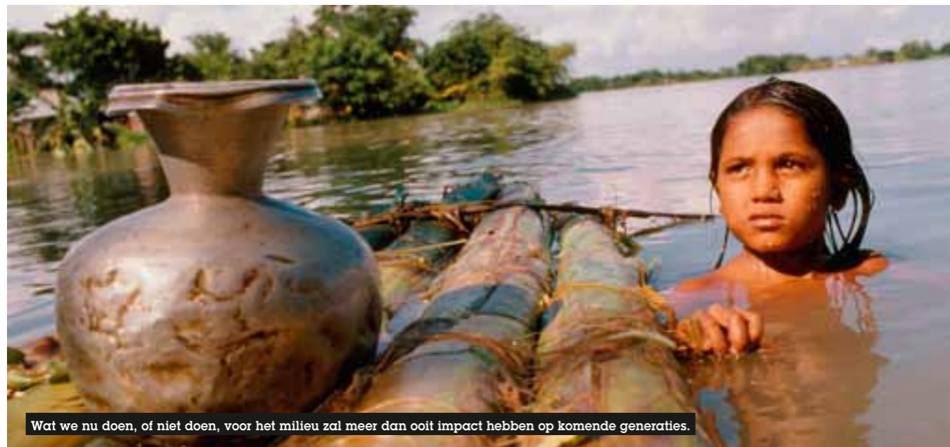
Wat we nu doen, of niet doen, voor het milieu zal meer dan ooit impact hebben op komende generaties.

Ethiek draait om levensstijlen; het is etymologisch afgeleid van het Griekse woord ethos , een manier van leven en omgaan met de wereld. Bovendien heeft enkel de mens zich een veelheid van ethos eigen gemaakt. De menselijke oorzaken van klimaatverandering kunnen dus