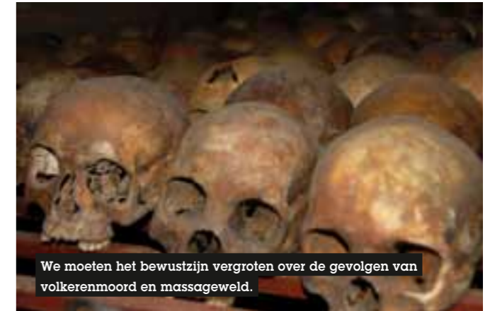
We moeten het bewustzijn vergroten over de gevolgen van volkerenmoord en massageweld.

"Onderwijs kan een rol spelen in het voorkomen van massageweld"