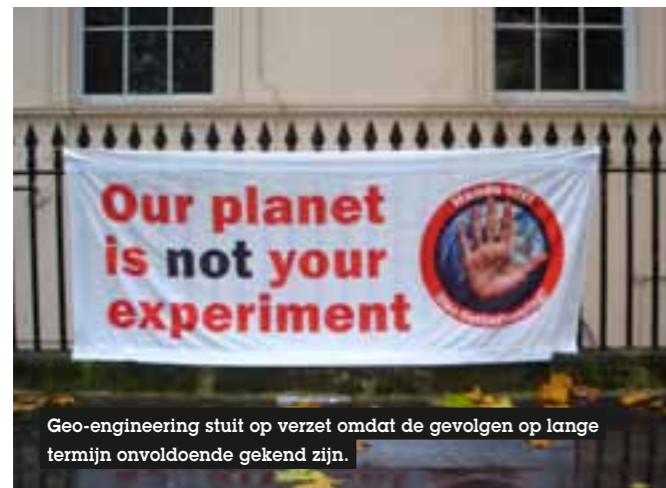
Geo-engineering stuit op verzet omdat de gevolgen op lange termijn onvoldoende gekend zijn.

Vorig jaar publiceerde UNESCO een document dat beleidsmakers duidelijk maakte dat er dringend nood is aan het afweging van de risico's verbonden aan bepaalde activiteiten, om de bevolking te betrekken in de besprekingen daaromtrent en om een internationaal kader te scheppen waarbinnen onderzoek op een verantwoordelijke en transparante manier gevoerd wordt.