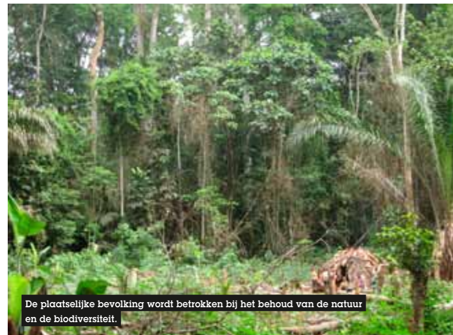
De plaatselijke bevolking wordt betrokken bij het behoud van de natuur en de biodiversiteit.

Het tweede project heet het Centraal-Afrika Werelderfgoed Regenwoud Initiatief (CAWHFI) en concentreert zich op een vijftal natuurparken in Centraal-Afrika die omwille van hun karakteristieken in aanmerking komen op als werelderfgoed te worden uitgeroepen. Belangrijk om weten is dat