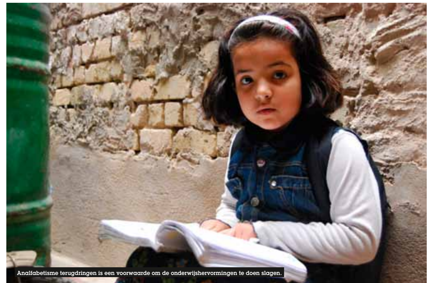
Analfabetisme terugdringen is een voorwaarde om de onderwijshervormingen te doen slagen.