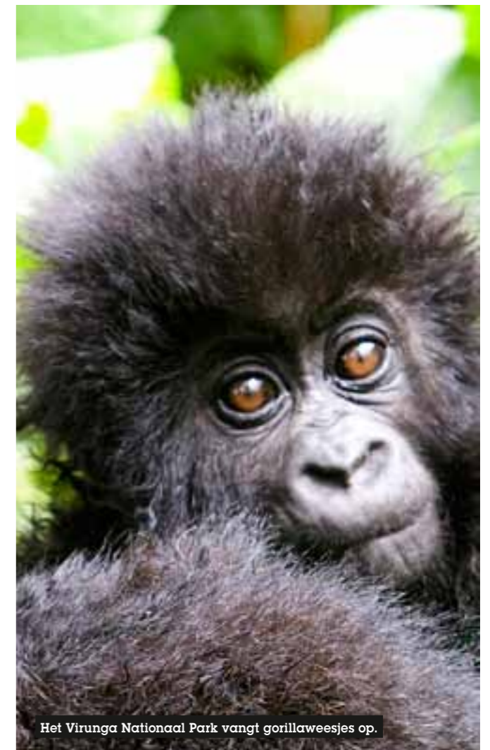
Het Virunga Nationaal Park vangt gorillaweesjes op.

Centraal-Afrika http://whc.unesco.org/en/cawhfi/ http://whc.unesco.org/en/list/1380/