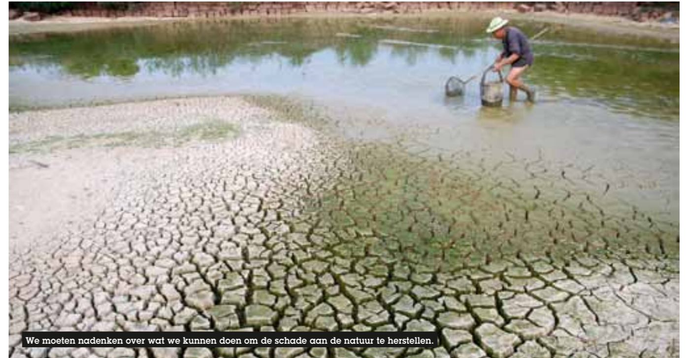
We moeten nadenken over wat we kunnen doen om de schade aan de natuur te herstellen.