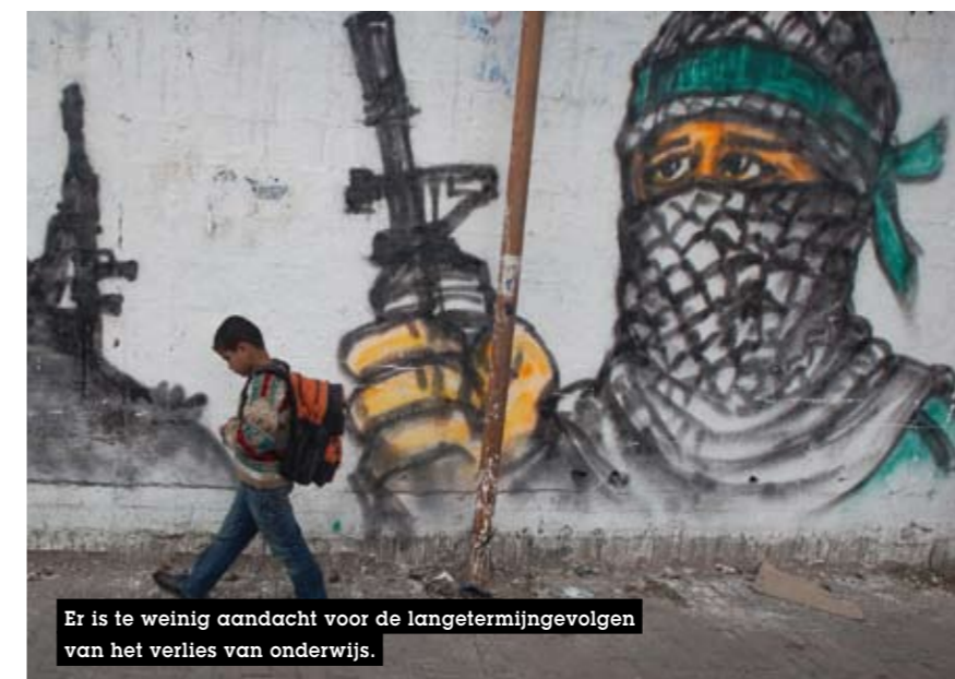
Er is te weinig aandacht voor de langetermijneffecten van het verlies van onderwijs.

De vraag is, moeten we ons zorgen maken over het verlies aan onderwijs? Verschillende studies tonen aan dat er bij heropbouw snel gewerkt wordt aan het herstellen van de structuren voor basisonderwijs. Maar er is veel minder informatie beschikbaar over de gevolgen op lange termijn die het verlies aan onderwijs heeft op de mensen en gemeenschappen die te lijden hadden onder een conflict.