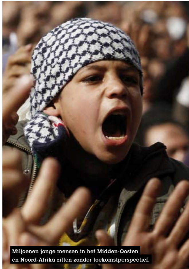
Miljoenen jonge mensen in het Midden-Oosten en Noord-Afrika zitten zonder toekomstperspectief.

De leiders in de regio moeten vaststellen dat demografie diepgaande sociale, politieke en economische gevolgen met zich meebrengt. Voor landen met een jonge bevolking is de onmiddellijke uitdaging om vaardigheden en economische kansen te ontwikkelen die uitzicht bieden op werkgelegenheid, veiligheid en hogere levensstandaarden. Die hoop is Mohammed Bouazizi ontnomen. En ontbreekt in het leven van miljoenen jonge mensen in het Midden-Oosten en Noord-Afrika. Het is de regio met de hoogste jeugdwerkloosheid. Een op vier jonge mensen zit zonder werk. In Tunesië bedraagt de jeugdwerkloosheid 31, in Egypte 34 procent.