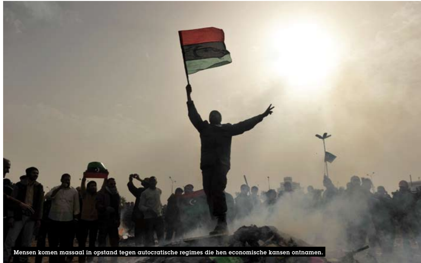
Mensen komen massaal in opstand tegen autocratische regimes die hen economische kansen ontnamen.

Het falen van het onderwijs is verbonden met andere tekortkomingen. In de Arabische landen blijven de aanbieders van onderwijs grotendeels doof voor de verzuchtingen van leerlingen en studenten. De verantwoordelijken voor het onderwijsbeleid zijn doorgaans een afspiegeling van de regeringen die ze dienen en die niet de gewoonte hebben om verantwoording af te leggen aan de bevolking.