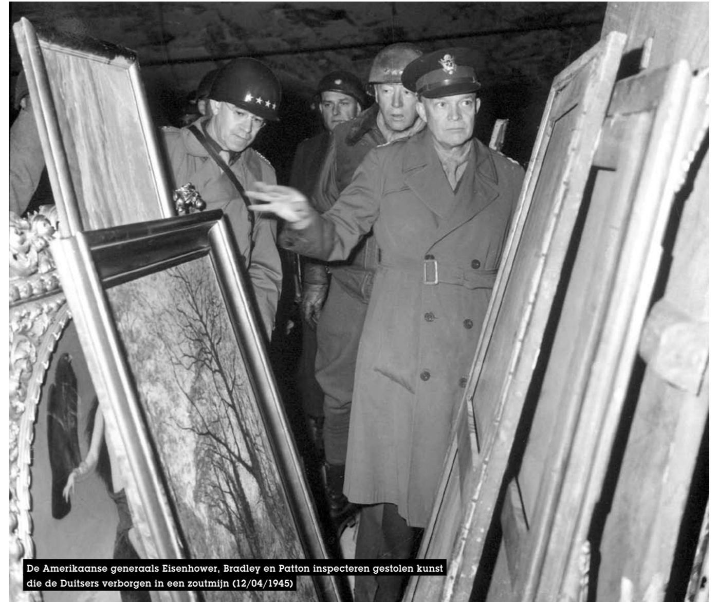
De Amerikaanse generaals Eisenhower, Bradley en Patton inspecteren gestolen kunst die de Duitsers verborgen in een zoutmijn (12/04/1945)

Het Verdrag van Den Haag is het meest bekend door de blauw-witte schildjes die als herkenningsteken op cultuurgooderen worden gehangen. Het Verdrag kent een categorie van goederen die onder “bijzondere bescherming” staan, wat wil zeggen dat zij ofwel een schuilplaats zijn met een hoge concentratie aan culturele goederen, ofwel onroerend erfgoed van groot cultureel belang. Dergelijke goederen worden aangeduid door drie samengeplaatste blauw-witte schildjes, en moeten ook worden ingeschreven in een internationaal register. Het verschil tussen de gewone en de bijzondere bescherming bestaat er – vereenvoudigd weergegeven – in dat afwijkingen van de bijzondere bescherming slechts mogelijk zijn ingeval van een “onvermijdelijke militaire noodzaak, en uitsluitend zolang deze noodzaak voortduurt” , terwijl het in andere gevallen volstaat dat “een militaire noodzaak een dergelijke afwijking gebiedend vereist” . Staten hebben echter zeer zelden gebruik gemaakt van de mogelijkheid om erfgoed in te schrijven in het internationale register voor culturele goederen onder bijzondere bescherming. ▶