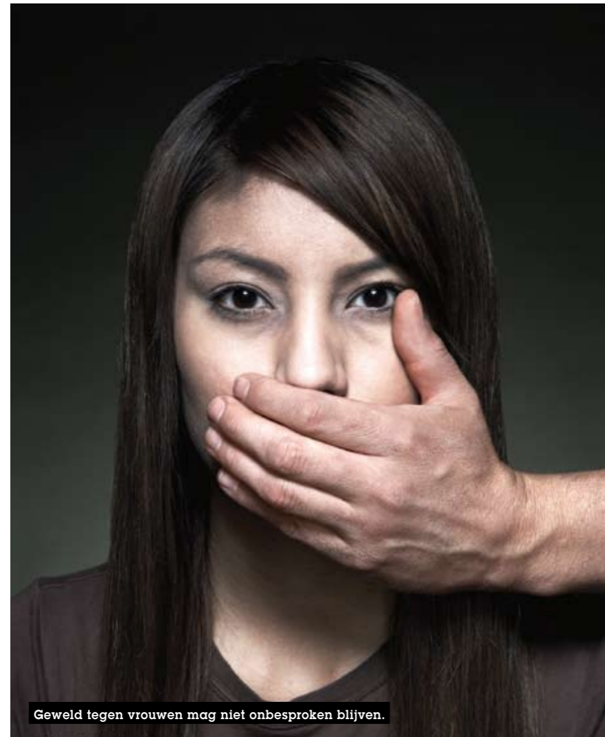
Geweld tegen vrouwen mag niet onbesproken blijven.

Michelle Bachelet: "Geweld tegen vrouwen is een van de meest voorkomende vormen van mensenrechtenschendingen. Het is een van de vijf prioriteiten van UN Women omdat vooruitgang op dit gebied een vooruitgang betekent voor vrouwen op verschillende andere vlakken. Zo heeft een vrouw die geen geweld moet vrezen betere vooruitzichten op een