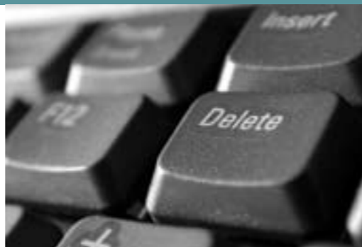
Vijftien landen worden door Reporters Zonder Grenzen als Internetvijanden bestempeld

Naar aanleiding van de eerste Online Free Expression Day publiceerde Reporters Zonder Grenzen een geactualiseerde lijst van de zogenaamde Internetvijanden . Dit zijn landen die volgens de organisatie al te ver gaan in het beknotten van de vrije meningsuiting op het