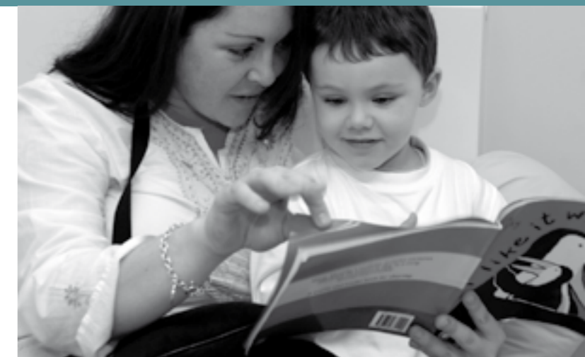
De moedertaal speelt een belangrijke rol bij de ontwikkeling van het kind.

De argumenten en voorstellen voor het gebruik (eigenlijk het niet-gebruik) van moedertaal in het rapport van 2004 over de preventie van delinquentie mag dan al zijn voorstanders hebben in politieke