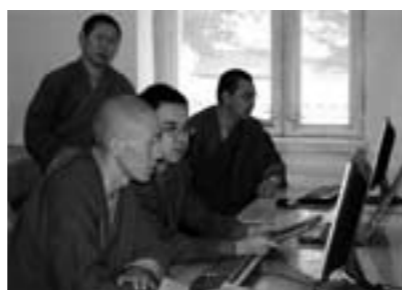
Boeddhistische monniken werken aan de digitalisering van hun documentair erfgoed.

Na een dergelijke opleiding, rustte de UNESCO de bibliotheek van het Gandan Tegchenling klooster uit met intranet/internet en met de nodige software en hardware om het documentair erfgoed te digitaliseren. Zes lama's kregen een opleiding over digitaliseringstechnieken van