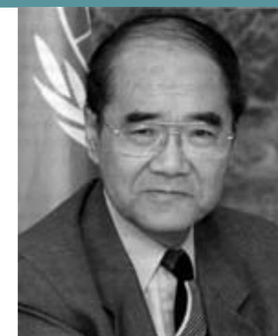
De UNESCO was de eerste organisatie binnen de Verenigde Naties die de principes van de Universele Verklaring van de Rechten van de Mens in al haar actiedomeinen toepaste.

Matsuura: “Met haar inspanningen ten voordele van kwalitatief onderwijs voor iedereen draagt de UNESCO uiteraard bij tot het vervullen van het fundamenteel recht op onderwijs dat op zijn beurt een schoolvoorbeeld is van hoe alle mensenrechten onlosmakelijk met elkaar verbonden zijn. We mogen niet vergeten dat onderwijs mensen in staat stelt om actief deel te nemen aan het politieke, economische en culturele leven. Een andere hindernis voor het vervullen van het recht op onderwijs is armoede. Armoede zorgt er voor dat een derde van de wereldbevolking zijn potentieel en talenten niet kan ontwikkelen en verhindert dat deze mensen een menswaardig leven leiden. Tientallen miljoenen mensen, vooral meisjes, hebben geen toegang tot onderwijs en dus