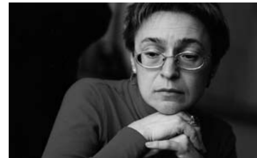
De Russische journaliste Anna Politkovskaya werd in oktober 2006 vermoord en kreeg in mei 2007 postuum de UNESCO Prijs voor Persvrijheid. Misdaden als deze worden onvoldoende onderzocht en de daders genieten straffeloosheid.

veiligheidsraad uit 2006 (die onder meer handelt over de veiligheid van journalisten die actief zijn in conflictgebieden en landen wijst op hun verplichtingen in het kader van het internationaal recht met onder andere de Conventies van Genève –n.v.d.r.). De Raad wil dat landen hun verantwoordelijkheid opnemen en opvolgen in welke mate er onderzoek gevoerd wordt naar moorden die bij monde van de directeur-generaal door de UNESCO veroordeeld worden. Landen waar dergelijke misdaden plaatsvonden moeten ook zelf spontaan meer verslag uitbrengen over de vooruitgang van het gerechtelijk onderzoek naar dergelijke feiten, aldus de Raad.