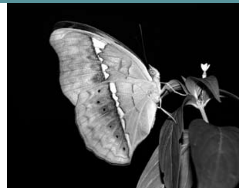
Zelfs wie niet bekommerd is om het uitsterven van vlinders en wilde bloemen moet toch beseffen dat als we nu niet ingrijpen, het alleen maar moeilijker zal worden in de toekomst.

Origineel was dat de Grenelle partners met verschillende overtuigingen samenbracht: bijvoorbeeld boeren die de landbouw verdedigen die voor een groot stuk steunt op het gebruik van pesticiden, maar ook milieuvrijwilligers die daarover bezorgd zijn. Een dergelijke bijeenkomst is een stap in de goede richting en ik denk dat er concrete acties uit zullen voortvloeien. Ten slotte zijn mensen niet gek. En zelfs wie helemaal niet geeft om vlinders en