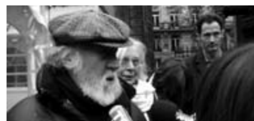
Hubert Reeves gaat de boer op om mensen te waarschuwen voor de gevolgen van de snelheid waarmee we plant- en diersoorten uitroeien.

Hubert Reeves: "Astrologie leert ons hoe we kwamen te bestaan op aarde maar ecologie leert ons hoe we hier kunnen blijven. We kennen de wonderen van de sterren en de melkwegstelsels, die verbonden zijn met ons verleden en ons heden, maar stellen vast