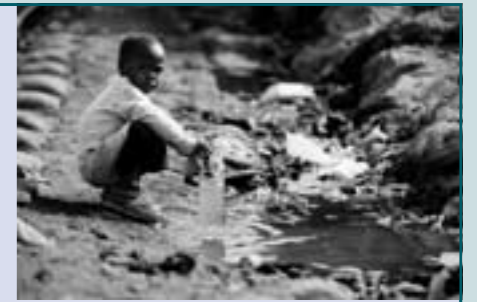
doodsoorzaak onder kinderen jonger dan 5 jaar.

Deze vaststelling is des te ernstiger aangezien vooruitgang op het vlak van sanitatie ook een invloed heeft op het behalen van de andere Millenniumontwikkelingsdoelen. Op plaatsen waar sanitaire voorzieningen aanwezig zijn, gaan meer kinderen naar school. Vooral meisjes worden vaak door hun ouders thuisgehouden als er geen toilet is. Voorlichting over persoonlijke hygiëne – zoals handen wassen – voorkomt ziektes als diarree, de op één na belangrijkste